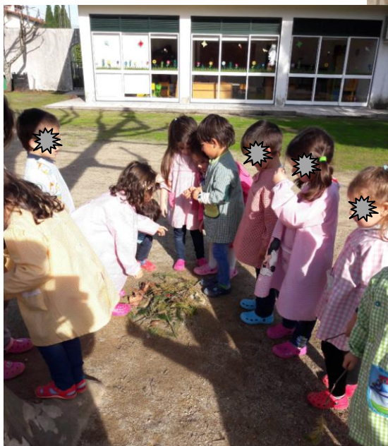
e fingindo que comíamos as castanhas