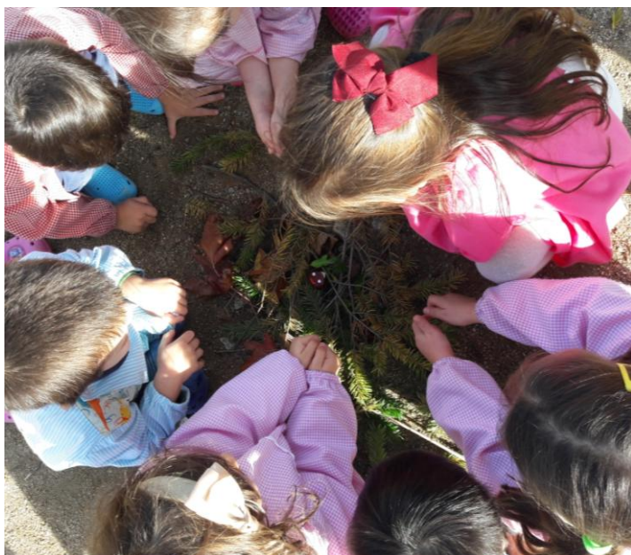
Acendendo a fogueira...